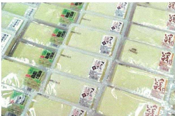
「霜里もめん豆腐」「霜里にがり豆腐」「霜里おぼろ豆腐」他、種類も豊富。