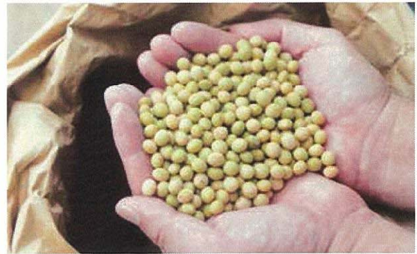
どの商品にも豊かな農地で育てられた美味しい大豆が使用されている。

店員と来訪客のコミュニケーションも積極的に行われており、その垣根のなさもファンやリピーター獲得の一因である。他にも、豆乳プリンなどのオリジナル商品で集客力を高めている。